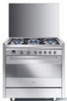
...❖ DE91SPMF5 Backofen, Edelstahl