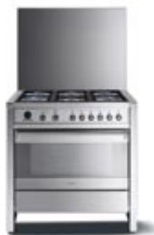
...❖ A1D-5 Backofen, Edelstahl