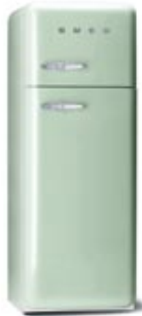
...❖ Standkühlschrank mit Gefrierraum, Rechtsanschlag, Energieeffizienzklasse B