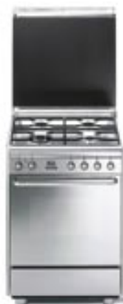
...❖ SCD60MFX Backofen, Edelstahl