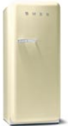
...❖ Standkühlschrank mit Gefrierfach, Rechtsanschlag, Energieeffizienzklasse A