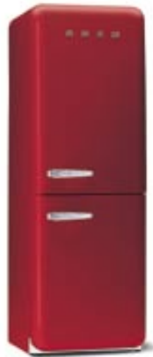
...❖ Standkühl- Gefrierkombination Rechtsanschlag, Energieeffizienzklasse A